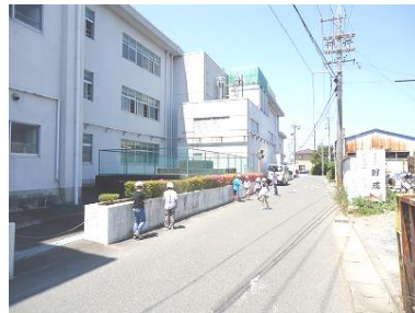
【2年生：小学校周辺にて】