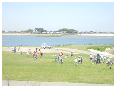
【5年生：ラブリバー公園にて】