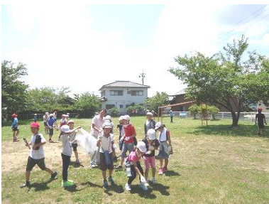
【4年生：下長屋児童公園にて】