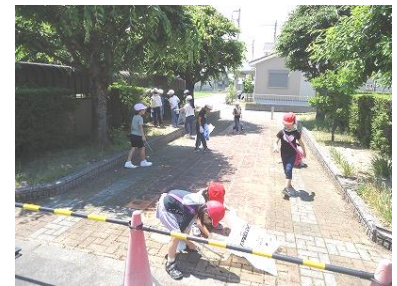
【3年生：ハートプラザにて】